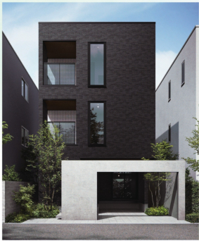
高い断熱性と優れた断熱性・省エネ性を併せ持った「xevo M3(ジーヴォ・エムスリー)」

大和ハウス工業は、省エネルギー建築で高い断熱性、高効率な省エネ機器、太陽光発電設備の搭載に加え、自然採光や自然換気など、自然の力も活用しながら省エネと快適性を追求している。平成22(2010)年に住宅業界で初めてZEH(ネット・ゼロ・エネルギー・ハウス)を、26(2014)年には銀行店舗でもZEB(ネット・ゼロ・エネルギー・ビル)を実現した。ZEHとは、住宅の断熱性能を大幅に向上させ