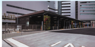
ZEB認証のバスターミナル=大阪市北区

同社と大阪マルビルは、大阪市北区の大阪マルビル跡地にZEB認証のバスターミナルを設置・整備し、2025年日本国際博覧会協会に無