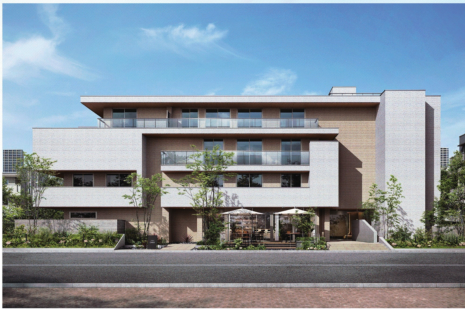
ZEH-Mに対応した賃貸住宅商品「THE STALELY(ザステイリー)」

大和ハウス工業は、省エネルギー建築で高い断熱性、高効率な省エネ機器、太陽光発電設備の搭載に加え、自然採光や自然換気など、自然の力も活用しながら省エネと快適性を追求している。平成22(2010)年に住宅業界で初めてZEH(ネット・ゼロ・エネルギー・ハウス)を、26(2014)年には銀行店舗でもZEB(ネット・ゼロ・エネルギー・ビル)を実現した。ZEHとは、住宅の断熱性能を大幅に向上させ