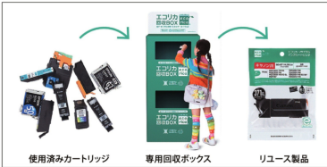
インクジェットプリンターの使用済みカートリッジを回収、製品化している

エコリカは、インクジェットプリンターの使用済みカートリッジを全国規模で回収し、再使用するシステムを2003年に国内で初めて実現した。現在、家電量販店やパソコン専門店など、全国1万カ所以上に回収ボックスを設置。回収した使用済みカートリッジは製品としてリユースし、製品化できないカートリッジはリサイクルとして再利用するなど、プラスチック資源の有効活用を推進している。