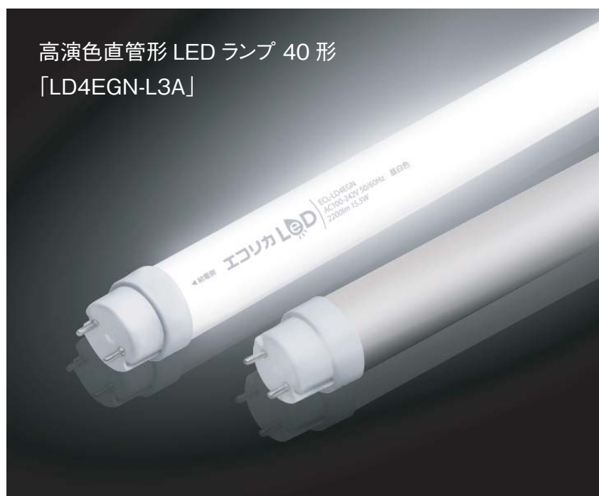
高演色直管形 LED ランプ 40 形 「LD4EGN-L3A」

明るさと演色性の両立が難しいといわれる昼白色タイプで、発光効率 117 lm/W を実現。より自然に見える昼白色タイプにより、印刷物などの色検査、美術館や博物館の照明などの用途に最適な光源です。